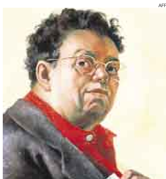
POR SÍ MISMO. Detalle del autorretrato que Rivera pintó en 1941.