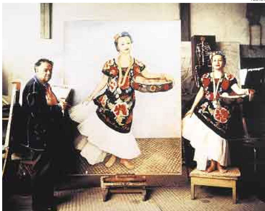
RETRATISTA. Diego Rivera adquirió fama mundial también por los cuadros que pintó de millonarios, actrices y amigos. Aquí, el artista en su taller durante la ejecución del retrato de la coleccionista Dolores Olmedo.