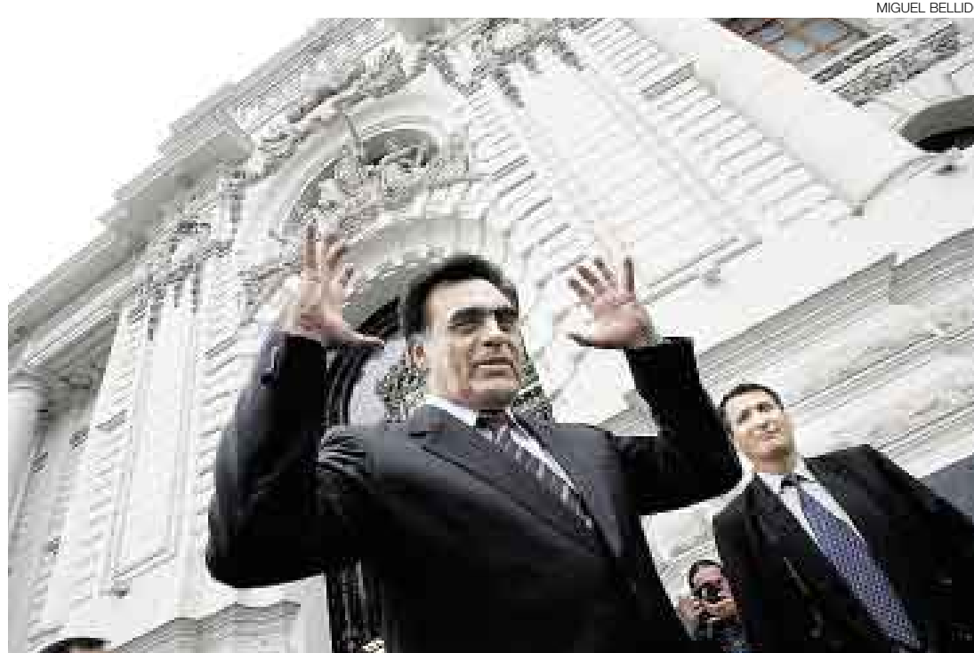
DEFIENDE SU FUERO. El titular del Congreso negó que el Ejecutivo le hubiera pedido ampliar la legislatura y reveló que ya venció el plazo para que este reglamento 48 de las 150 leyes pendientes de dicho trámite.

Consultado sobre si hay algún mecanismo para corroborar que