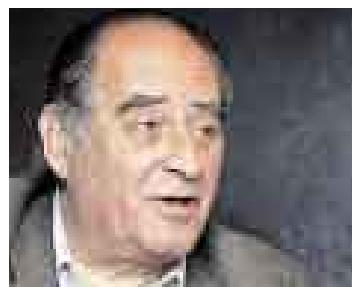
ÁNTERO. Su primera prueba.

El ministro de Defensa, Antero Flores-Aráoz, condenó ayer de manera enérgica el ataque perpetrado el lunes contra una patrulla policial en Ayacucho y aseveró que el Gobierno responderá con mucha inteligencia frente a estos hechos de violencia.