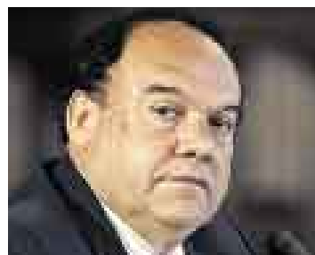
ALVA CASTRO. ¿Responderá?

■ El congresista Alberto Andrade considera que se debe citar a Alva Castro a la Comisión de Defensa