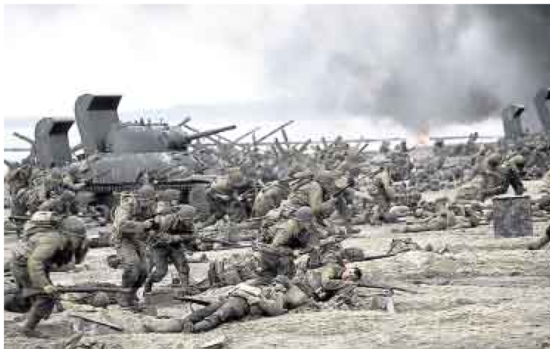
RESCATANDO AL SOLDADO RYAN. Sus escenas bélicas podrían ser las mejores de la historia del cine.