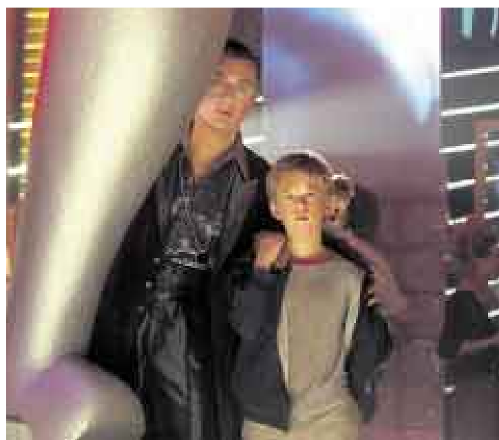
INTELIGENCIA ARTIFICIAL. Jude Law y Haley Joel Osment en un filme ideado originalmente por Stanley Kubrick.