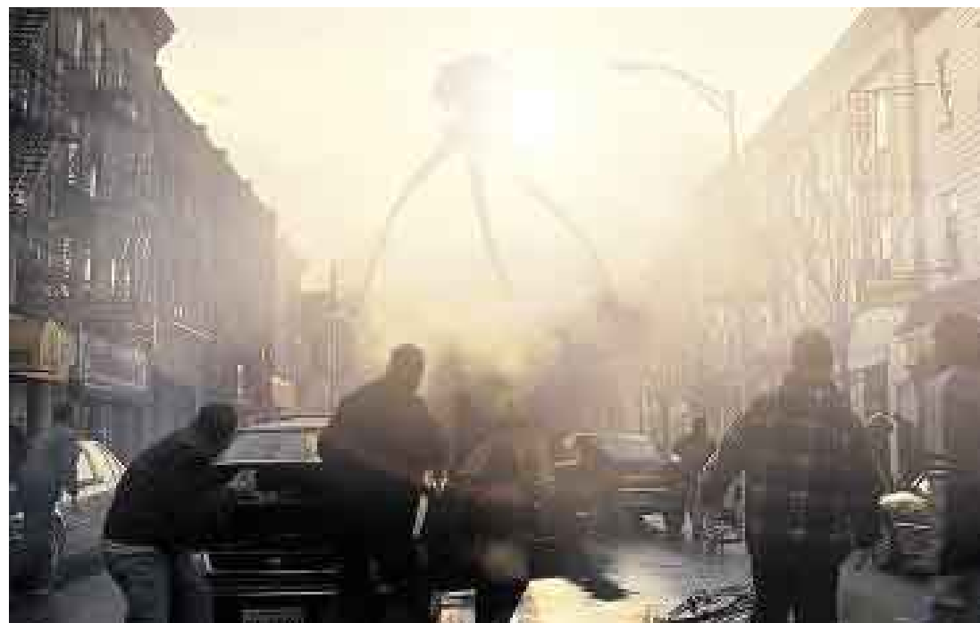
LA GUERRA DE LOS MUNDOS. La invasión extraterrestre obsesiona a Spielberg desde la infancia.