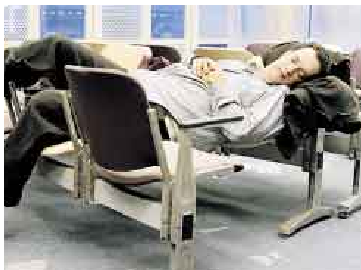
LA TERMINAL. Tom Hanks, uno de los actores favoritos de Spielberg, en una comedia dramática basada en un caso real.

de horror "Night Gallery". El joven Spielberg se aproximó a la diva con cuidado y todo resultó bien. Pero Crawford detectó el tremendo talento de su director. Un día, durante el rodaje, un grupo de periodistas se le acercó para hacerle una entrevista. La actriz simplemente les dijo: "¡Entrevisten a ese muchacho; será el mejor director de todos los tiempos!"