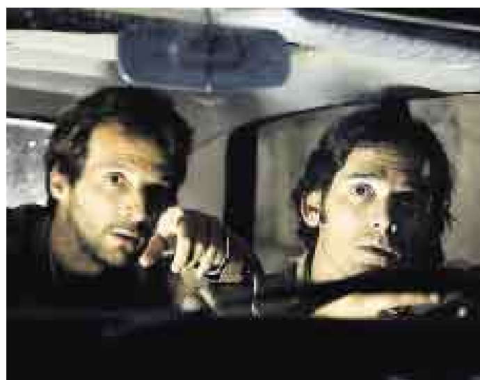
MÚNICH. Mathieu Kassovitz y Eric Bana en una intriga política sobre la venganza de Israel tras los atentados en las Olimpiadas de 1972.