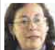
CARMEN DE LOS RÍOS CENTRO LOYOLA

“Todos los centros de salud de Ayacucho deberían contar al menos con un psicólogo. La reparación a las víctimas, la atención de su salud y resolver la indocumentación de muchos sería un gran paso para saldar deudas con ellos”.