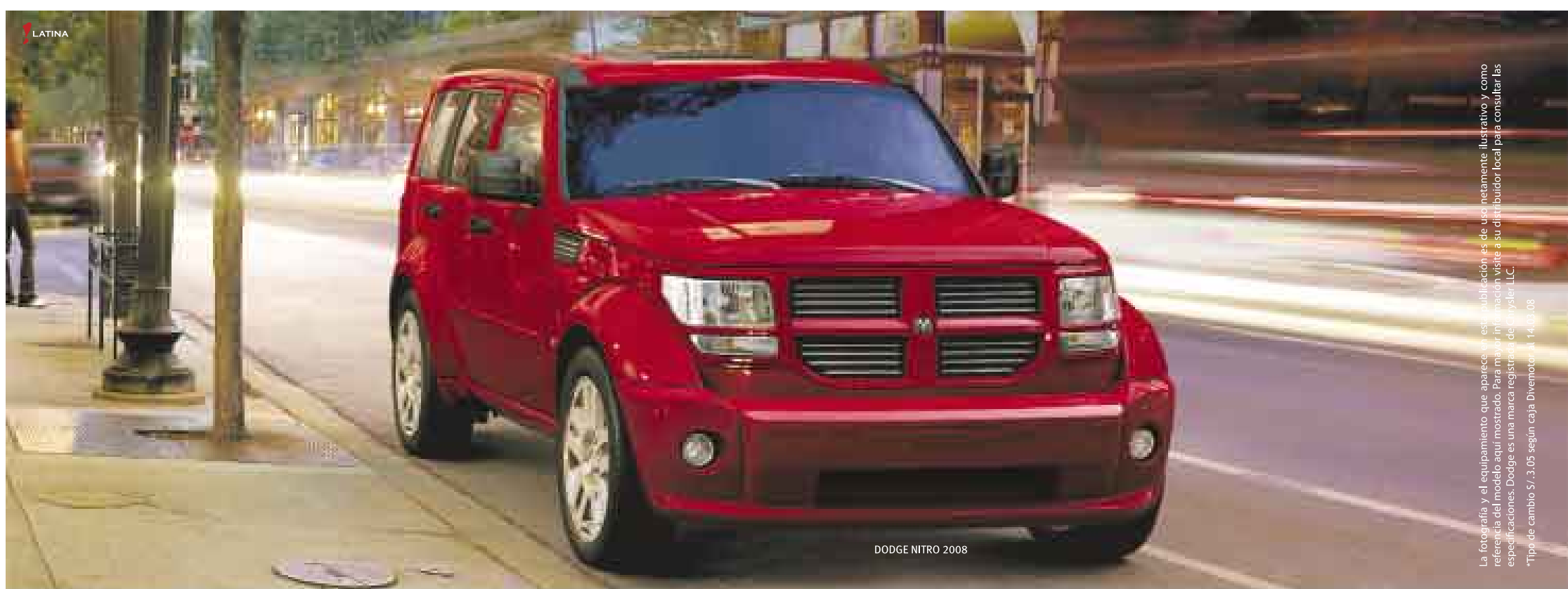
DODGE NITRO 2008

Un alto oficial del Grupo Aéreo 51 de Pisco acudió a la comisaría de San Andrés para averiguar sobre el hecho, pero se retiró sin dar explicaciones. Los airados pobladores de esotra caleta pesquera destruyeron los vidrios del local policial.