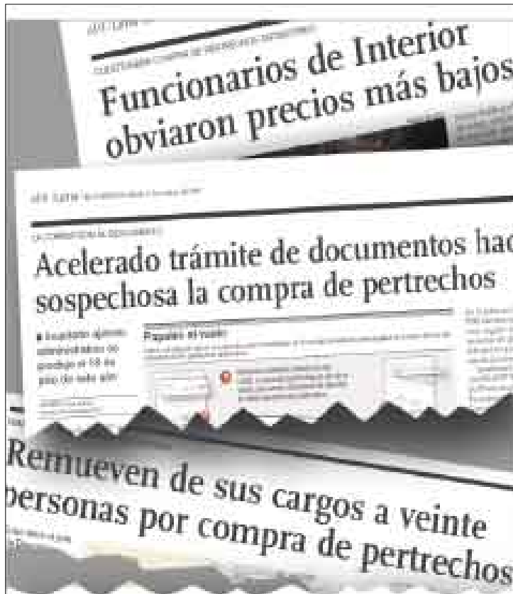
EN CAMPAÑA. Diversos informes publicados por El Comercio , el año pasado, pusieron en evidencia una operación bastante sospechosa.

Como se recuerda, en esa oportunidad la Dirección de Logística de la PNP iba a comprar a la empresa Combyned Systems INC. de Estados Unidos 35 mil granadas lacrimógenas CS triple, 50 mil cartuchos lacrimóge-